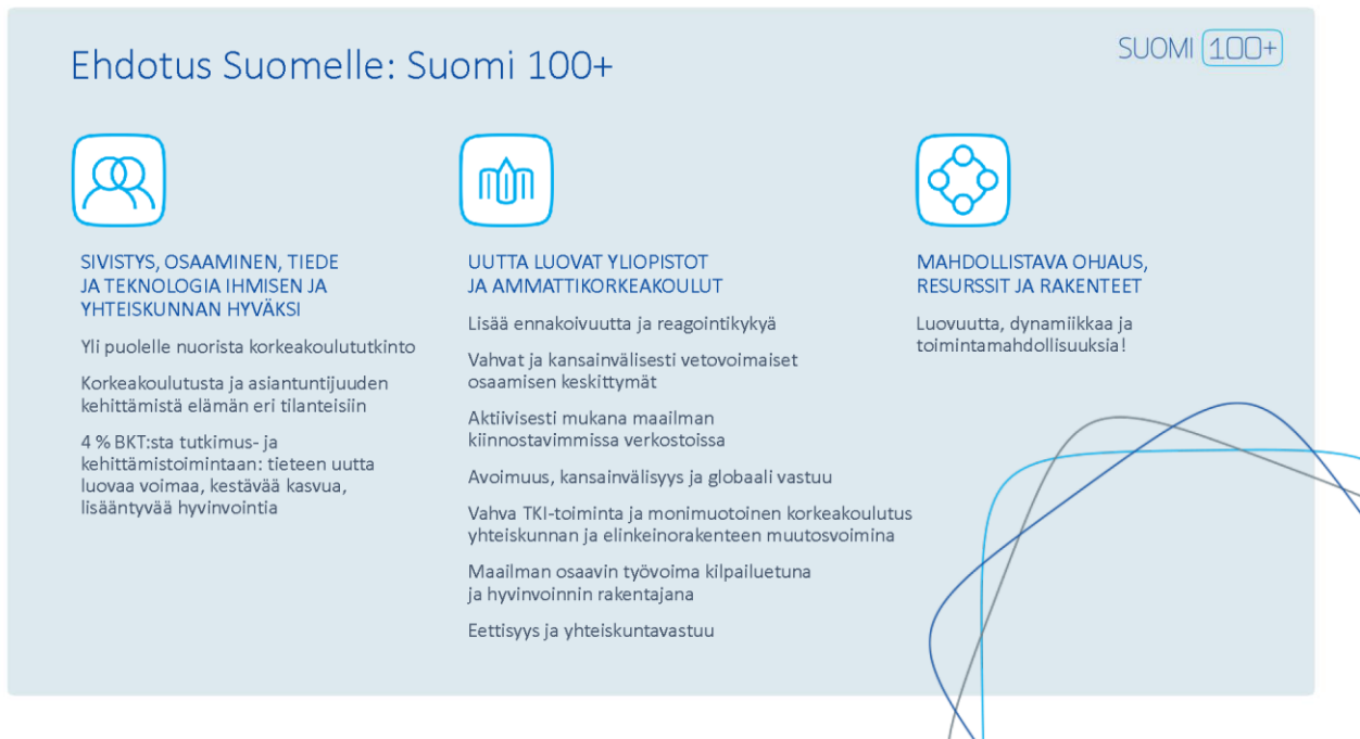
Kuvio 1. Korkeakoulutuksen visio 2030. Ehdotus Suomelle: Suomi 100+. (OKM 2017a).

Visio esitetään alla olevana kuviona, jossa on kolme isoa tavoitetta koko korkeakoulujärjestelmälle ja niitä täsmentäviä tavoitteita, joista suurinta osaa voidaan pitää merkittävänä myös koulutustarjonnan arvioinnin ja kehittämisen näkökulmasta.