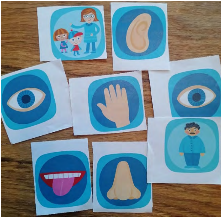
KUVA 3. Ohjaajiin ja heidän ohjaukseensa liitettyjä kortteja.

Ohjaajia kuvattiin usein ”kivoiksi”. Lasten ja nuorten ei ollut keskusteluissa aina helppoa määrittellä sitä, mikä tekee ohjaajasta kivan. ”Se on vaan kiva” mainittiin useaan kertaan. Kivat ohjaajat olivat lisäksi iloisia, hauskoja, ystävällisiä ja kilttejä ja ottivat kaikki huomioon. Ohjaajan mukavuus liitettiin usein konkreettisesti esimerkiksi siihen, että hän osaa keksiä mukavaa tekemistä harrastuskerroille.