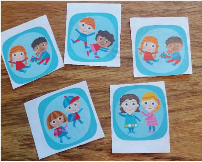
KUVA 2. Kavereita kuvaavia kuvakortteja

Suurin osa keskustelijoista mainitsi yksinkertaisesti harrastusryhmässä olevan kavereita. Kaverit saattoivat olla samalta tai toiselta luokalta, omasta tai toisesta koulusta. Osa on löytänyt harrastuksesta uusia kavereita, osa mennyt sinne kavereiden mukana, osa huomannut harrastuksen alkaessa siellä aloittavan samaan aikaan tuttuja kavereita. Harrastuksissa kerrottiin usein olevan suurin osa kavereista mukana.