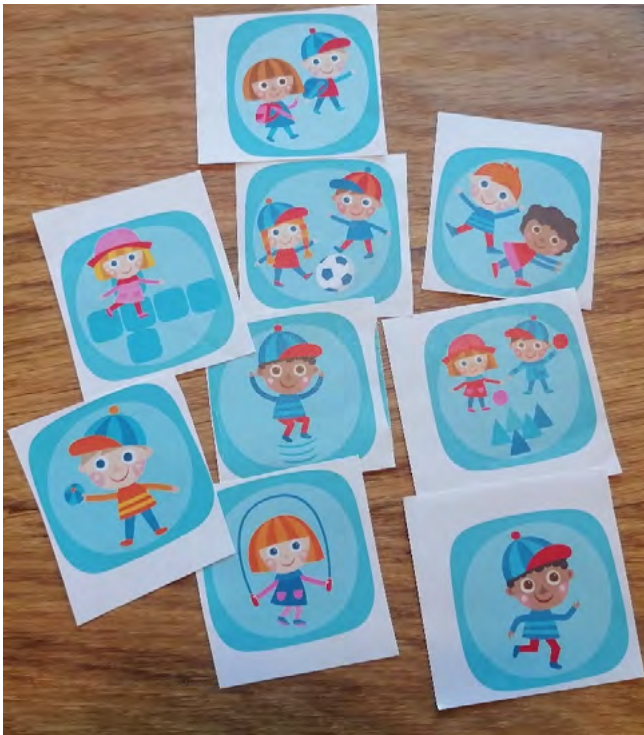
KUVA 1. Harrastusta kuvaavia kuvakortteja

Harrastuksessa itse tekeminen, harrastuksen sisältö, oli tärkeää, vaikka siihen vaikutti monta muuta tekijää. Harrastuksen sisältöä kuvattiin usean eri kuvakortin kautta (KUVA 1). Tässä aluvussa käsitellään lasten ja nuorten harrastamiselle antamia merkityksiä. Ensimmäisessä kohdassa käsitellään harrastuksen joustavuuden ja vaihtelevuuden merkityksiä harrastamisen mielekkyydelle. Seuraavassa osiossa tarkastellaan kavereiden merkitystä harrastukseen lähtemisessä ja siellä käymisessä. Kolmas osio siirtyy puolestaan harrastuksenohjaajiin liittyviin kokemuksiin, niin ohjaajien ammattitaidon kuin ”mukavuuden” näkökulmista. Viimeiseksi käsitellään lasten ja nuorten hyvinvointia harrastusten tarjoaman mielekkään vapaa-ajan ja harrastuksiin juurtumisen näkökulmista.