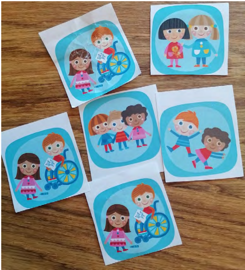
KUVA 4. Yhdenvertaisia harrastusmahdollisuuksia kuvaavia kuvakortteja

Sitten kun me muut juostaan niin [oppilas] rullaa! (Alakoulun oppilas, kunta 1)