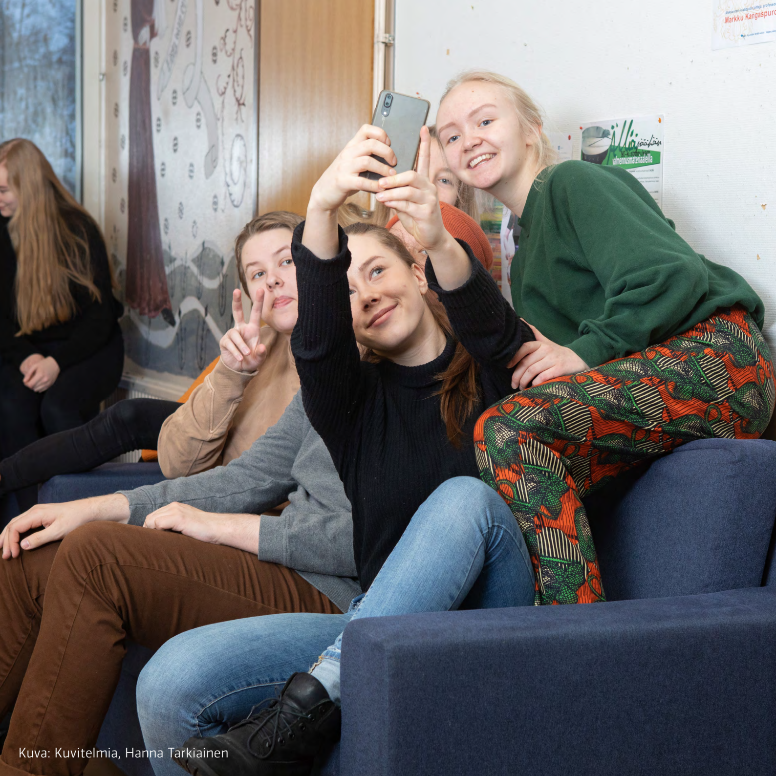
Kuva: Kuvitelmiä, Hanna Tarkiainen