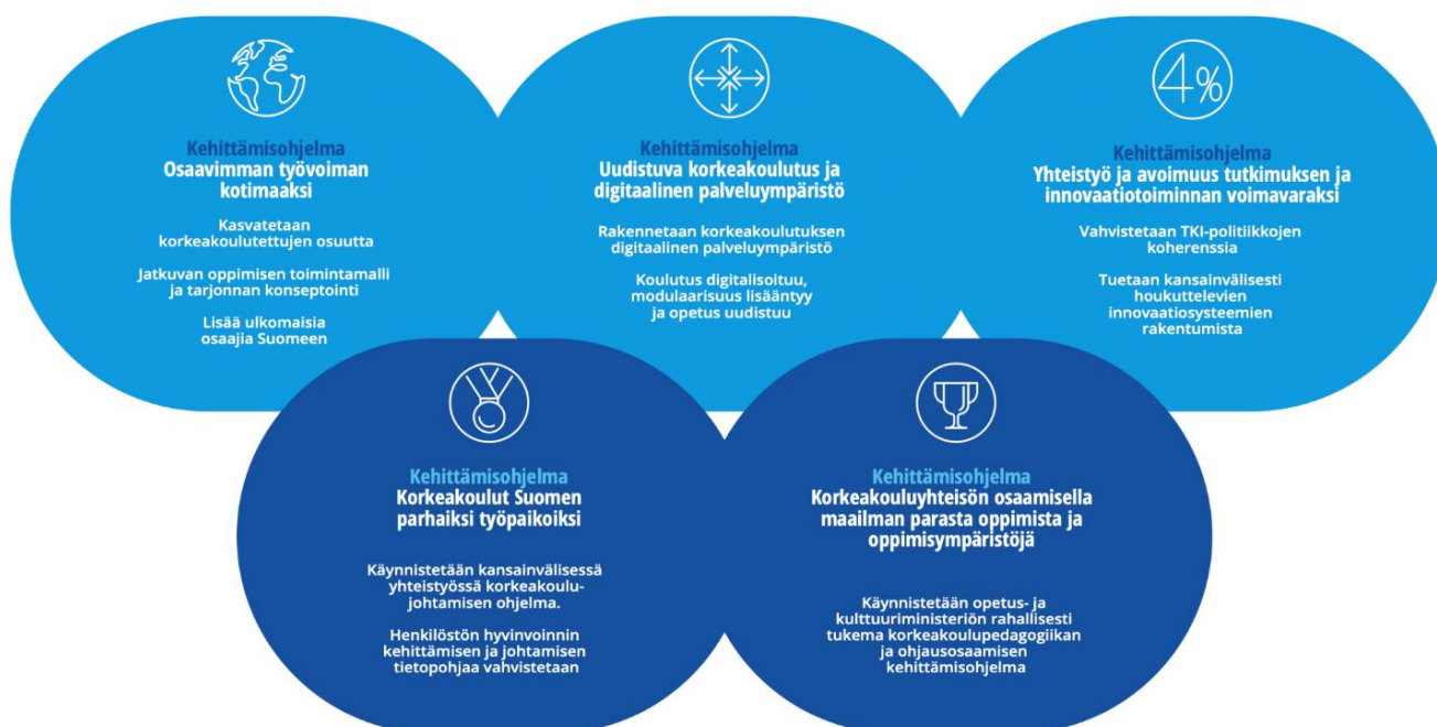
KUVIO 4. Korkeakoulutuksen ja tutkimuksen tiekartan viisi kehittämisohjelmaa (OKM 2019b)

Korkeakoulutuksen ja tutkimuksen tiekartassa linjataan kehittämisohjelmien tavoitteista ja käynnistettävästä toiminnasta seuraavaa: